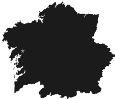
O Concelho de Dodro limita com as Comarcas de Muros-Noia e o Barbança.